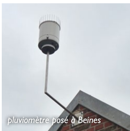
pluviomètre posé à Beines

Un pluviomètre a été posé début janvier sur le secteur de Beines (Guiscard). Ce pluviomètre permettra de connaître la pluviométrie du secteur de la Verse de Guivry et, prochainement, d'alerter la population en cas de dépassement d'un seuil d'alerte.