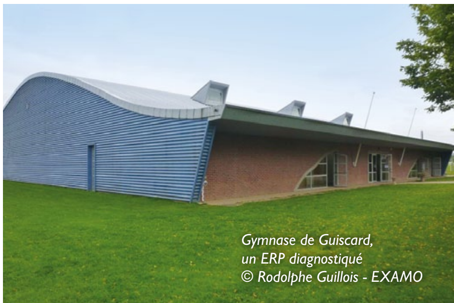
Gymnase de Guiscard, un ERP diagnostiqué

4 établissements recevant du public ont été diagnostiqués à Guiscard : l'école publique du centre, la salle multifonctions, le gymnase et la Poste. Deux diagnostics n'ont pas pu être réalisés : celui de la gendarmerie, dû à une absence de réponse, et celui de l'école privée Sainte-Philomène, en raison du refus du diocèse de Beauvais de donner suite à la demande de l'Entente Oise-Aisne.