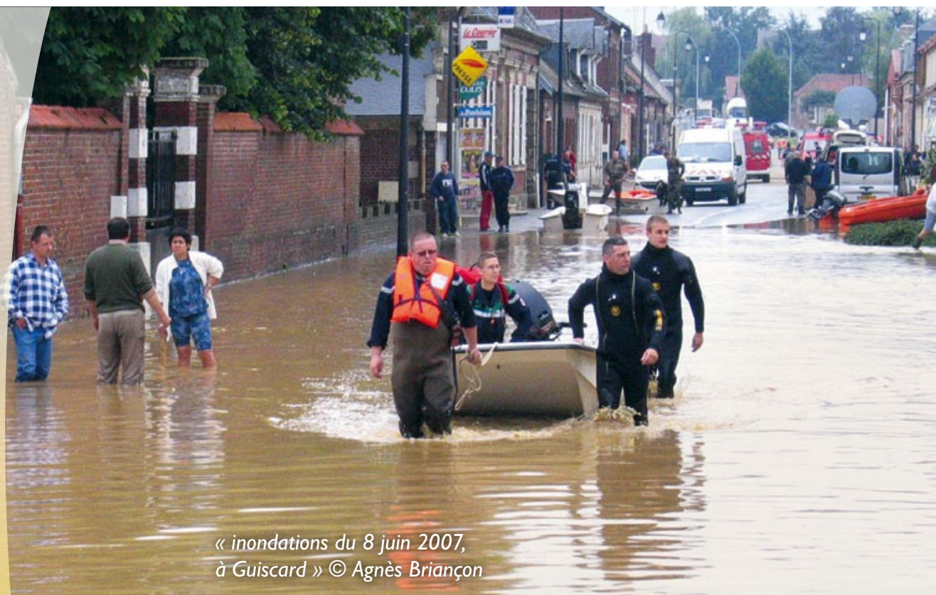
« inondations du 8 juin 2007, à Guiscard »

Avricourt Beaugies-sous-bois Beaulieu-les-Fontaines Beaumont-en-Beine Beaurains-les-Noyon Berlancourt Bussy Campagne Candor Catigny Crisolles Ecuville Flavy-le-Meldeux Fréniches Frétoy-le-Château Genvry Golancourt Guiscard Guivry Lagny Le Plessis-Patte-d'Oie Maucourt Morlincourt Muirancourt Noyon Ognolles Pont-l'Évêque Porquericourt Quesmy Salency Sempigny Sermaize Vauchelles Villeselve