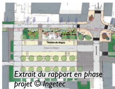
Extrait du rapport en phase projet

Les travaux pourront débuter à la réception de l'avenant à la convention-cadre signé et de l'arrêt préfectoral d'autorisation. Les travaux sur les ouvrages de franchissement seront finalisés après la mise en service de l'ouvrage de Muirancourt.