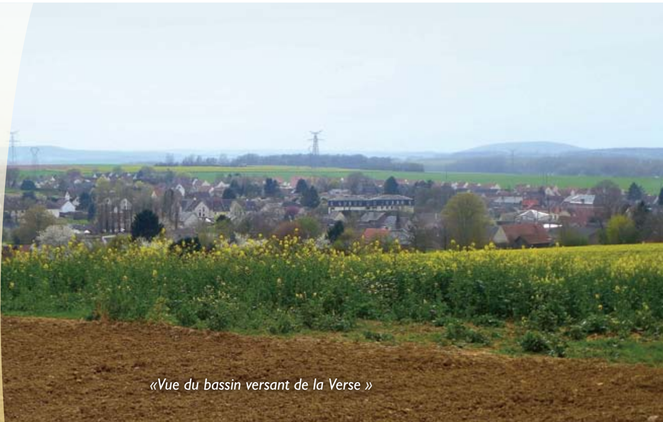
«Vue du bassin versant de la Verse »

Avricourt Beaugies-sous-bois Beaulieu-les-Fontaines Beaumont-en-Beine Beaurains-les-Noyon Berlancourt Bussy Campagne Candor Catigny Crisolles Ecuvilly Flavy-le-Meldeux Fréniches Frétoy-le-Château Genvry Golancourt Guiscard Guivry Lagny Le Plessis-Patte-d'Oie Maucourt Morlincourt Muirancourt Noyon Ognolles Pont-l'Évêque Porquericourt Quesmy Salency Sempigny Sermaize Vauchelles Villeselve