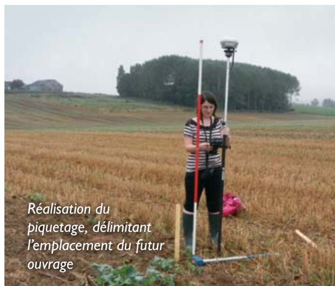
Réalisation du piquetage, délimitant l'emplacement du futur ouvrage

Les ouvrages en gabions sont constitués de roches et galets de différentes tailles qui filtrent les particules solides présentes dans les coulées de boues ; ces pierres sont retenues par un grillage métallique.