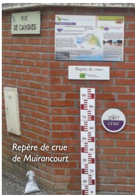
Repère de crue de Muirancourt

Il permet de conserver le souvenir de l'évènement pour les populations.